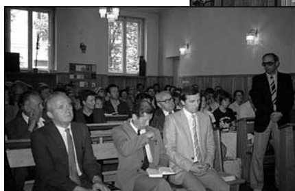
Lata 80. Kaplica przed rozbudową

Pierwsze nabożeństwo odbywa się we czwartek, 8 marca 2001 roku, w wynajętej sali hotelu „Pod Grotem” 7 . To początek regularnych nabożeństw w tej części Warszawy pod kierownictwem pastora Krzysztofa Zaręby. Oficjalna inauguracja ma miejsce 28.10.2001 r. w sali konferencyjnej Daewoo. W ten sposób warszawski zbór zaczął spotykać się w niedzielę trzykrotnie i w dwóch miejscach: na Puławskiej o 9:30 i o 11:30 oraz o 10:30 po drugiej stronie Wisły – w wynajętym pomieszczeniu na ul. Jagiellońskiej. Te dwa miejsca zgromadzeń dzieli około 15 km.