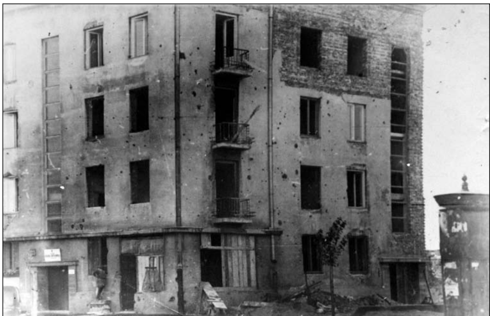
Rok 1948. Puławska 114 w trakcie remontu. Jest już sztyl Kościoła przy wejściu od ul. Puławskiej. Nie ma jeszcze tej części budynku, w której docelowo miała mieścić się kaplica (na prawo od wejścia przy słupie ogłoszeniowym)

Kaplica na parterze miała być wykończona i otwarta 1 grudnia 1950 roku, ale aresztowania to uniemożliwiają. Kościołowi zostaje odebrane prawo odbudowy 3 . Dokwaterowano lokatorów nie związanych z Kościołem. Przez dwa lata nabożeństwa odbywają się w mieszkaniach prywatnych albo w kaplicy przy Al. Jerozolimskich.