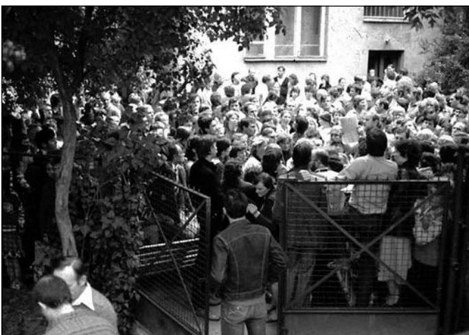
Dystrybucja darów na podwórku przy kaplicy. Dziś podwórka już nie ma, zostało zabudowane pod kaplicę