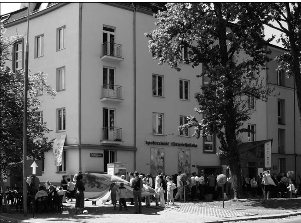
Puławska 114, rok 2006. Festyn kończący akcję „Przyjaźni ludziom”

Dynamicznie rozwija się działalność młodzieżowa. Przy dużym udziale „Puławskiej” zostaje zakończony pierwszy etap budowy ośrodka w Ostródzie (dziś Ostróda Camp) i 3 lipca 1983 roku następuje uroczyste otwarcie.