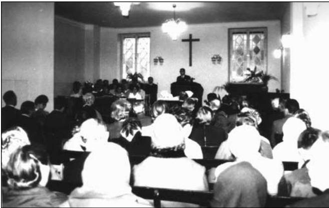
Święto Żniw 1968 – w kaplicy na parterze