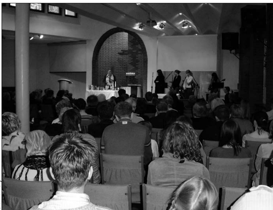
Obecna kaplica, powstała przez zabudowanie podwórka