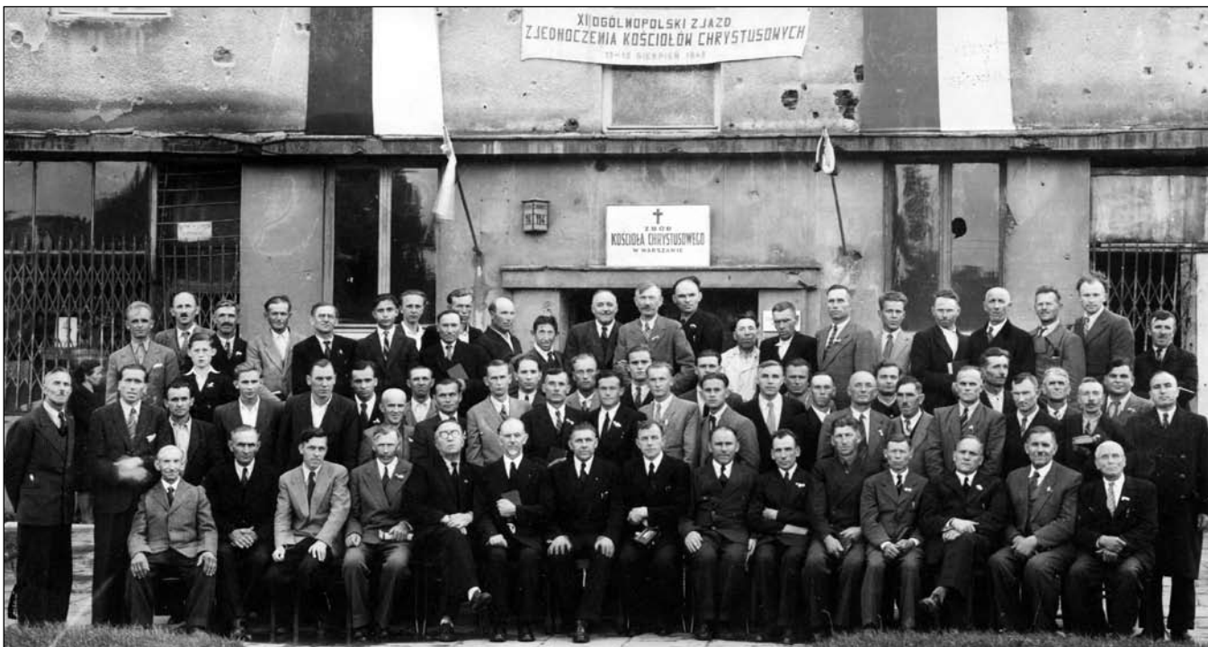
W dniach 13–15 sierpnia 1948 r. na Puławskiej odbył się XII Ogólnopolski Zjazd ZKCh