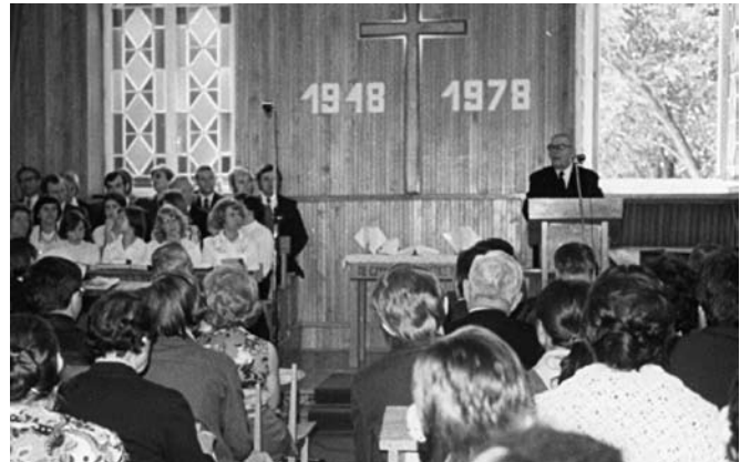
30-lecie zboru, rok 1978