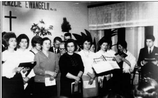
Pierwsza kaplica mieściła się na I piętrze (wejście od Puławskiej). Na zdjęciach migawki z lat 60.