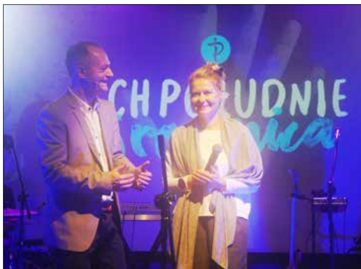
for. N. Flury

Dyskusje, wspólne spotkania, budowanie relacji, modlitwa, szukanie przykładów do kazań, dzielenie się tym, w jaki sposób rozumiesz lub nie rozumiesz Boga, opinie i sugestie po wysłuchaniu kazania, Twoje osobiste doświadczenia przeżywane z Bogiem – to wszystko może służyć lepszemu zrozumieniu naszego Boga.